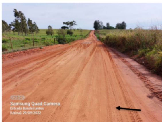
Trecho 01 – (início estrada até 470 m)

COMPRIMENTO: 5.107,58 metros - Lobato – PR 10/03/2025