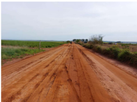
Trecho 03 – (de 850 até 2.100 m)