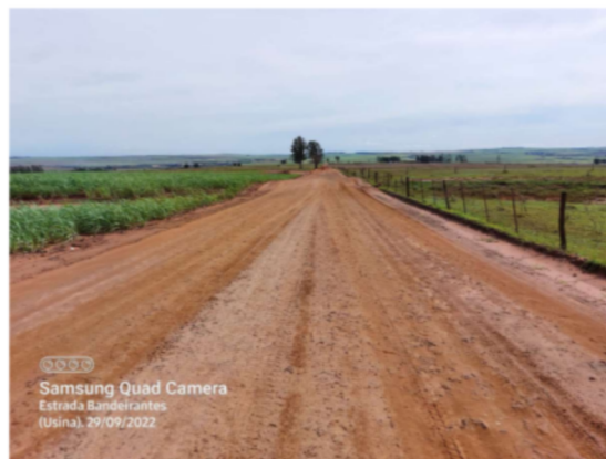
Trecho 04 – (de 2.100 até 3.160 m)