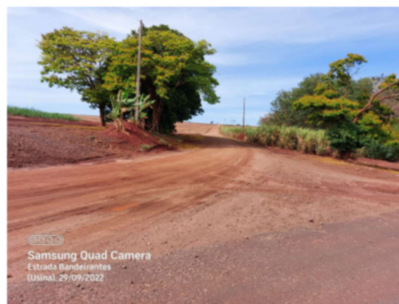
Final da Estrada – Estrada Canavieira