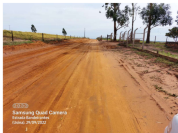
Trecho 02 – (de 470 até 850 m)