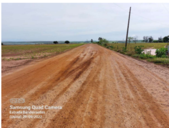
Trecho 05 – (de 3.160 até final estrada)